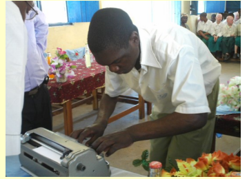
La machine Perkins permet d'écrire le braille

Au nord de la Tanzanie, au bord du lac Victoria, la ville de Mitindo accueille la seule école « inclusive » de la région de Mwanza. L'inclusion n'y est en effet pas un vain mot puisque élèves handicapés et non handicapés s'y côtoient. Sur les 1'200 écoliers, une quarantaine sont sourds et aveugles et 96 souffrent d'albinisme (cf. encadré). Les croyances du pays considérant le handicap comme une malédiction, les structures d'accueil pour ces enfants marginalisés ont longtemps été inexistantes. Aide et Action, épaulée des autorités locales, s'est engagée en 2003 dans ce projet d'école intégrant les exclus dans le système éducatif de base. Les fonds récoltés au travers du parrainage ont été dédiés à améliorer le bâtiment scolaire de Mitindo; une salle-ressources permettant aux enseignants de faire la classe aux enfants malvoyants y a été construite et du matériel pédagogique acheté, notamment des machines à écrire le braille. Composées de 9 touches, elles permettent d'écrire sur du papier épais et comportent un avertisseur sonore de fin de ligne.