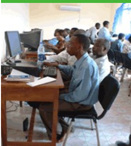
Centre ressources pour les enseignants à Mwanza

C'est en 1996 qu'Aide et Action a lancé ses premiers programmes en République unie de Tanzanie . Elle intervient dans la région de Mwanza au Nord, dans les districts de Magu et Misungwi et sur les deux îles de Zanzibar (Unguja et Pemba). L'accès à l'éducation s'étant considérablement améliorée ces dernières années dans le pays, Aide et Action s'engage aujourd'hui à améliorer la qualité de l'enseignement et de l'environnement scolaire . Cette année, près de 80 écoles ont ainsi bénéficié de nouveau matériel : fournitures, construction de cantines et latrines, création de maisons d'enseignants. Les maîtres sont ainsi formés dans des centres ressources où ils disposent d'un accès à Internet.