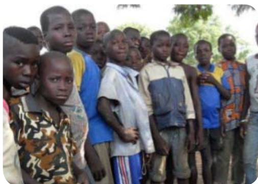
Les futurs apprenants des ER (groupe des garçons)

Les inondations consécutives à une pluviométrie exceptionnelle en 2007 et 2008 ont mis en péril l'économie togolaise particulièrement dans la région des Savanes (zone de couverture du projet) et le secteur de l'éducation suite à la rupture du trafic sur la route Lomé-Ouagadougou, l'anéantissement des champs de cultures, la destruction des dizaines d'ouvrage d'accès et de franchissement et des infrastructures scolaires.