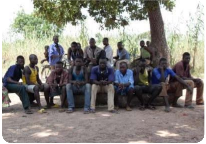
Les postes scolaires candidats à la formation professionnelle